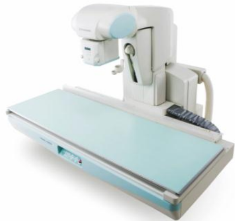
透視装置 (骨密度測定 長尺撮影 嚥下造影検査)